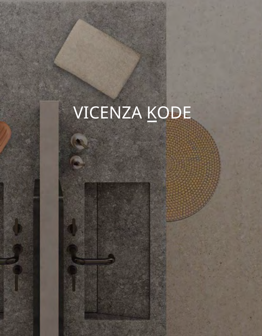
VICENZA K ODE