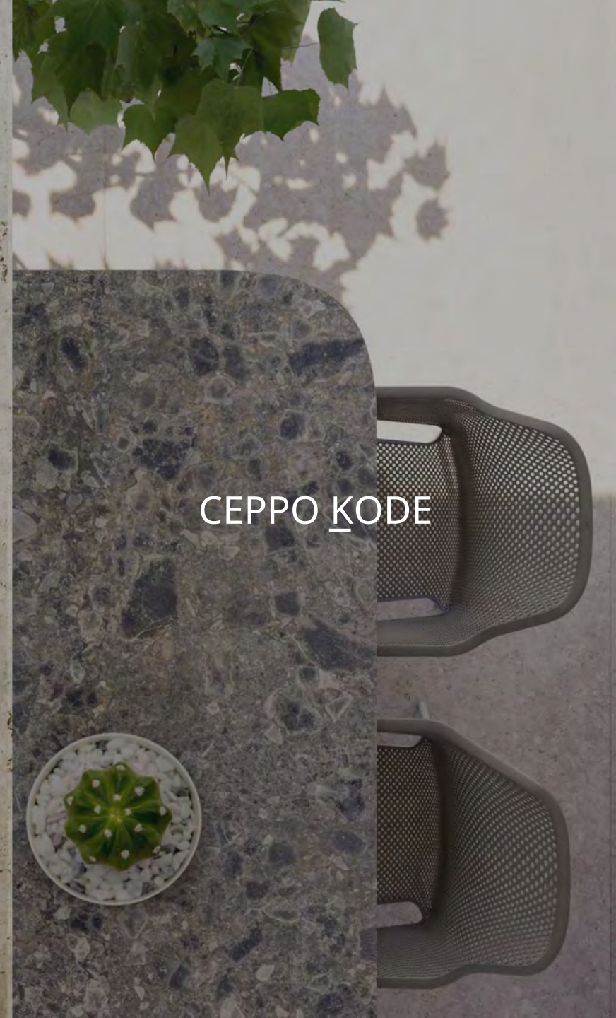
CEPPO K ODE